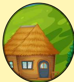
CHÁCARA NO INTERIOR