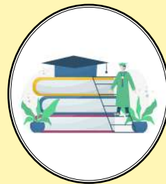
DESCONTOS EM CURSOS