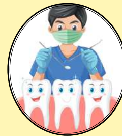
DESCONTOS EM CLÍNICAS